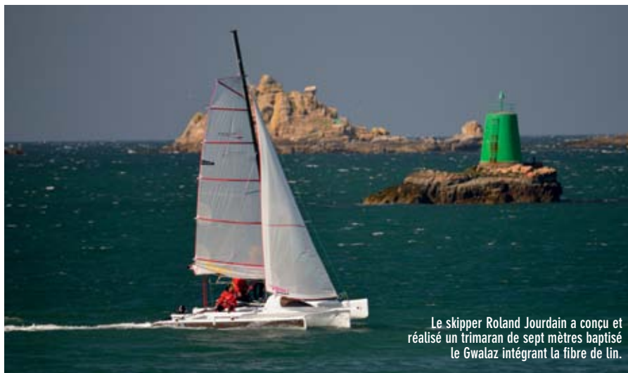
Le skipper Roland Jourdain a conçu et réalisé un trimaran de sept mètres baptisé le Gwalaz intégrant la fibre de lin.

L'histoire n'en restera pas là. Certains verrous techniques restent encore à lever, mais les débuts se montrent très prometteurs. De grands groupes industriels poursuivent des programmes de recherches conséquents comme Forestia, Bombardier, Alstom, Boeing, Eurocopter... L'épopée du lin en tant que matériau composite reste donc à construire et à suivre. ●