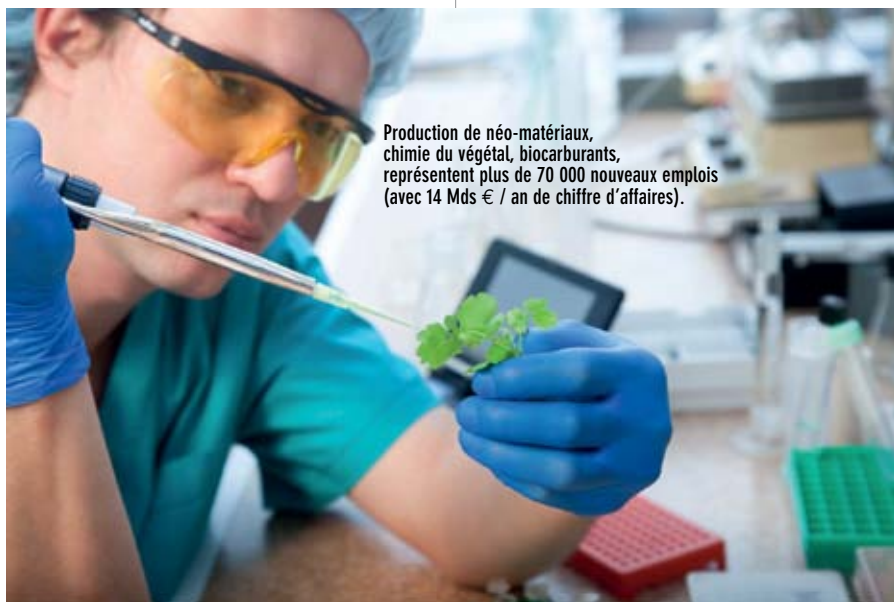
Production de néo-matériaux, chimie du végétal, biocarburants, représentent plus de 70 000 nouveaux emplois (avec 14 Mds € / an de chiffre d'affaires).

La France a probablement été le premier pays en Europe à définir une stratégie bioéconomique, étudiée dès 2003, avec en appui un plan biocarburants, un plan biocombustibles et un plan chimie du végétal et biomatériaux. Cette stratégie fut présentée et approuvée en Conseil des Ministres en 2006. Aujourd'hui, il s'agit seulement pour la France d'affiner cette analyse à la lumière des nouvelles stratégies européennes et du nouveau paquet énergie climat, avec les engagements climat de cop 21 en vue. N'oublions pas que la bioéconomie pèse pour