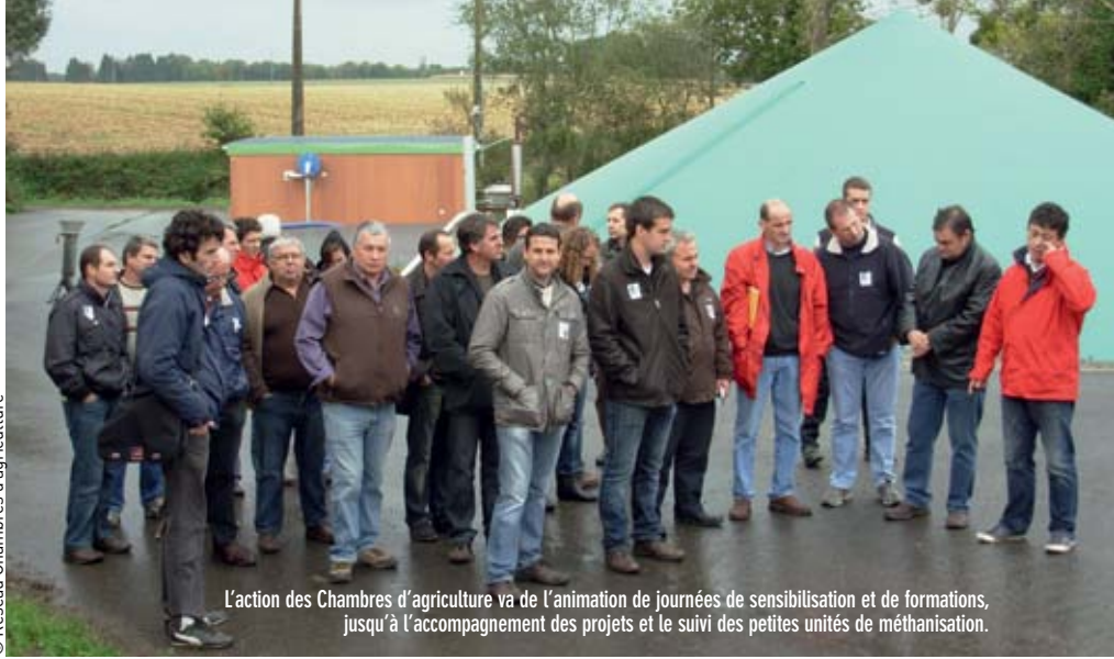
L'action des Chambres d'agriculture va de l'animation de journées de sensibilisation et de formations, jusqu'à l'accompagnement des projets et le suivi petites unités de méthanisation.

L. LEJARS : Depuis plusieurs années les Chambres d'agriculture de la Région Centre réalisent des enquêtes auprès des unités de méthanisation en fonctionnement. En 2013, nous avons pu percevoir des remarques sur quelques difficultés que nous rapportaient des agriculteurs-méthaniseurs lors de leur première année d'installation. Pour clarifier ces propos nous avons donc mis en forme une enquête en 2014 pour cerner plus clairement ces difficultés. Au final, nous avons identifié quatre sources de difficultés sur les 11 unités en fonctionnement à l'époque sur la région. Les deux plus fortes (sur plus de 80 % des cas) étaient liées à la trésore-