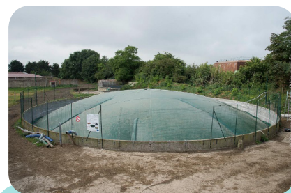
Couverture flottante récupérant le biogaz NENUFAR à la ferme Grignon Energie Positive (AgroParisTech)

Résultats : le projet doit démontrer si la solution est rentable économiquement et quantifier les réductions de méthane naturellement émis. Les premiers résultats seront disponibles fin 2016.