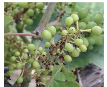
Rot brun

Pas d'intervention cette semaine. Rappel : intervenez avant les pluies si vous êtes en fin de rémanence ou si lessivage.