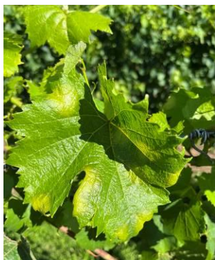
Mildiou sur feuille

Sur les autres secteurs, les parcelles sont globalement saines .