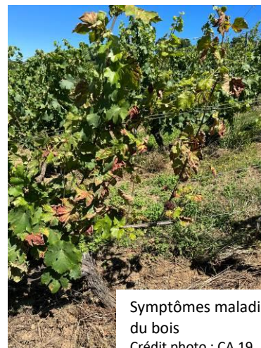
Symptômes maladies du bois