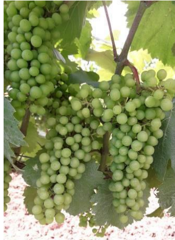
Fermeture de la grappe Eichhorn-Lorenz 33 BBCH 77

Les parcelles sont encore au stade « fermeture de la grappe ».