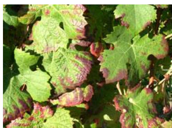
Dégâts de grillure sur cépage rouge : IFV