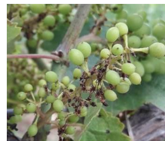
Rot brun

Le risque de contamination et de repiquage est fort pour tous les secteurs. Les contaminations épidémiques sont modélisées à partir de 3 mm.