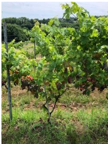
Symptômes présence cicadelle verte Crédit photo : CDA 19

✚ SOKALCIARBO WP ( Kaolin ), 10 kg/ha (dose homologuée), ZNT 5m, DRE 6h, DAR 15 jours, 4 applications/an