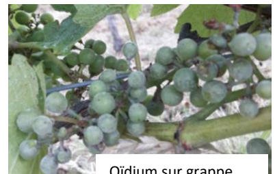
Oïdium sur grappe

La période de sensibilité maximum est terminée sur les parcelles saines et qui sont au stade « fermeture de la grappe ». En cas de symptômes, la période de risque se prolongera même jusqu'à la « véraison ».