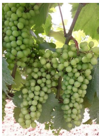
Fermeture de la grappe Eichhorn-Lorenz 33 BBCH 77

Le stade « fermeture de la grappe » est atteint sur toutes les parcelles. Nous sommes sur une année précoce comparable au millésime 2020 où la véraison a débuté entre le 15 juillet et 20 juillet.